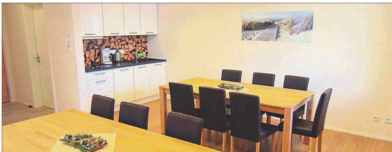
Ein großzügiger Gemeinschaftsraum gehört ebenfalls zum zweiten Bauabschnitt des „Seniorengerechten Wohnens“.

In der Errichtung von Seniorenimmobilien ist die Balk Gruppe übrigens bereits erfahren: So wurde 2012 das „Betreute Wohnen an der Vils“ in Vilsbiburg fertiggestellt und 2014 das „Betreute Wohnen in Pfeffenhausen“. Aktuell in Planung sind das seniorengerechte Wohnen „Alte Ziegelei“ in Rottenburg an der Laaber sowie das seniorengerechte Wohnen in Neumarkt-Sankt Veit.