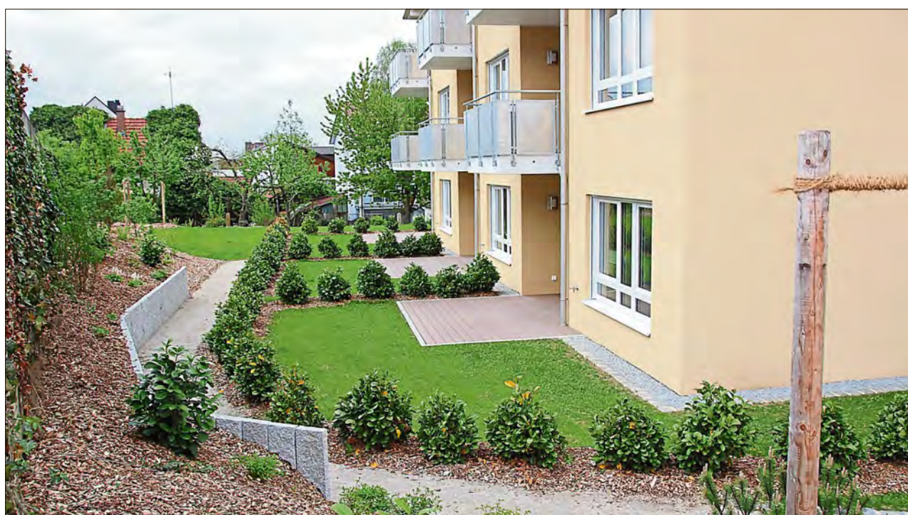
Die Gartenanlagen bieten viel Freiraum, sich zu erholen und die ruhige Lage zu genießen.

Das „Seniorengerechte Wohnen Velden“ unterstützt ein selbstbe-