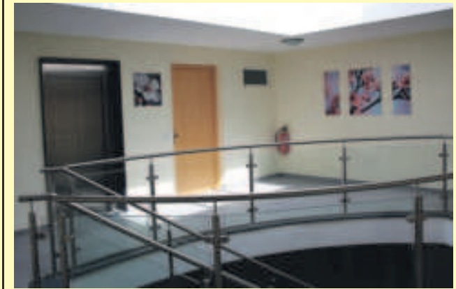
Impressionen vom Seniorenrechtliches Wohnen Velden: Gemein- schaftsraum und Treppenhau.