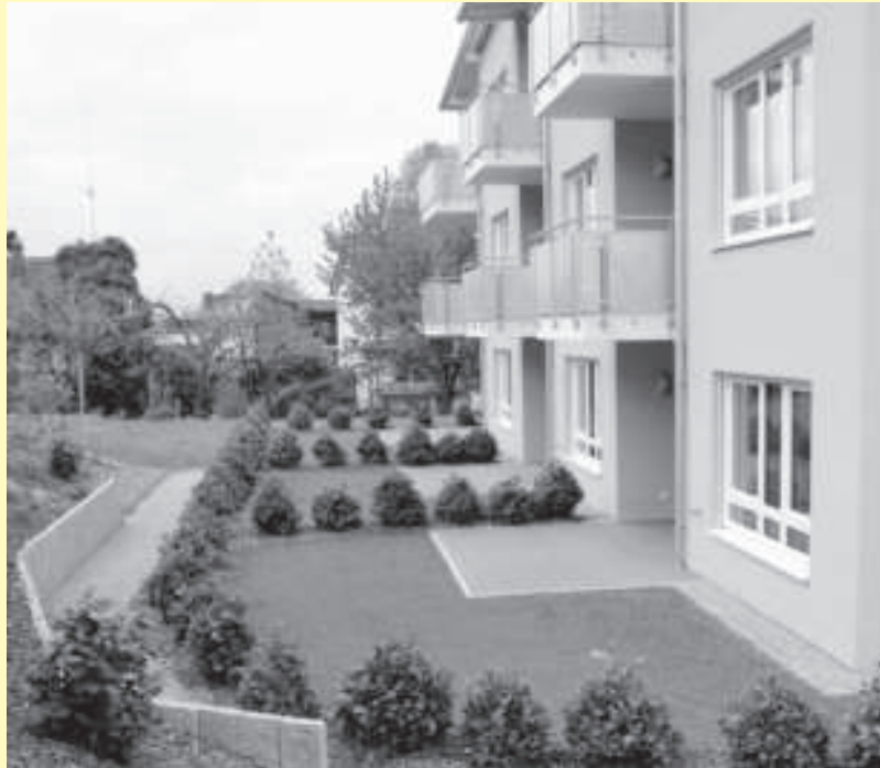
Die Wohnanlage ist in ein ansprechendes Umfeld eingebettet.