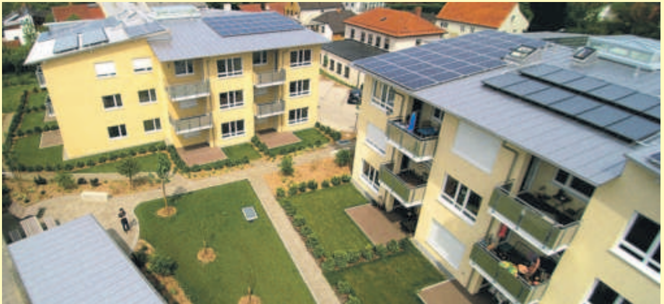
Die neue Wohnanlage aus der Vogelperspektive.