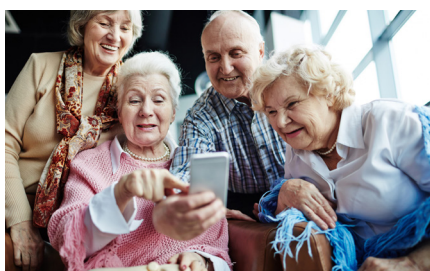
Gemeinsam statt einsam