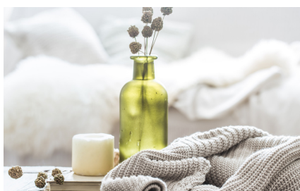
Funktionalität, Sicherheit und Komfort