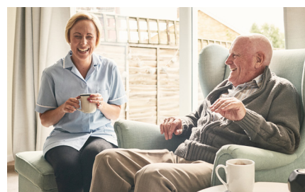
Individuelle Unterstützung bei Bedarf